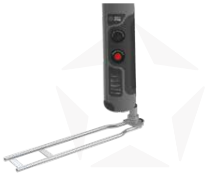
AUTOSTELLFUSS MIT ROTATOR

DANK EINER VIELFALT VON STELFFUSS BASEN KÖNNEN STARX FLAGS AUF DEN VERSCHIEDENSTEN UNTERGRÜNDE VERWENDET WERDEN.