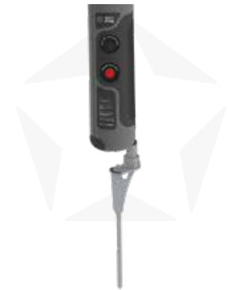
ERDDORN MIT ROTATOR

OPTIONAL SANDGEFÜLLTE GEWICHTE ZUR ERHÖHUNG DER STABILITÄT DES KREUZFUSSES. ERHÄLTICH IN VERSCHIEDENEN VARIANTEN FÜR JEDES STARX FAHNENMODELL.