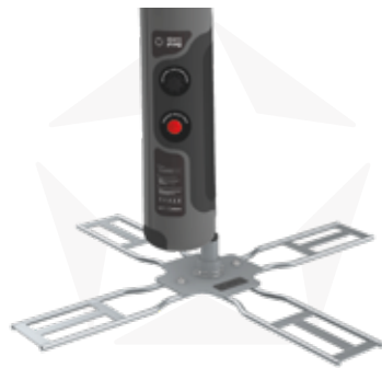
KREUZFUSS MIT ROTATOR

SCHWENKFUSS FÜR DIE VERWENDUNG MIT FAHRZEUGEN. EINFACH AUF DIE BASIS MIT DEM RAD EINES AUTOS FAHREN, UND SO EINE STABILE UND WIRKSAME POSITION DER FAHNE ERHALTEN.